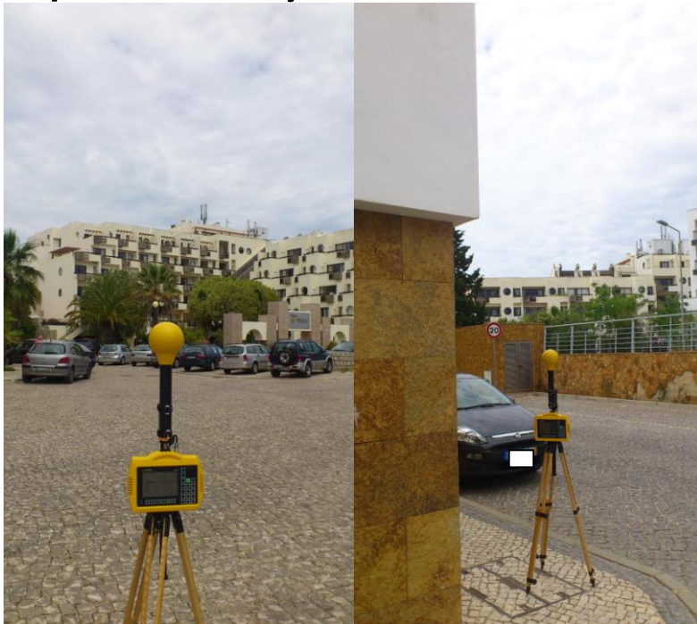
Fig. 3 – Ponto 1