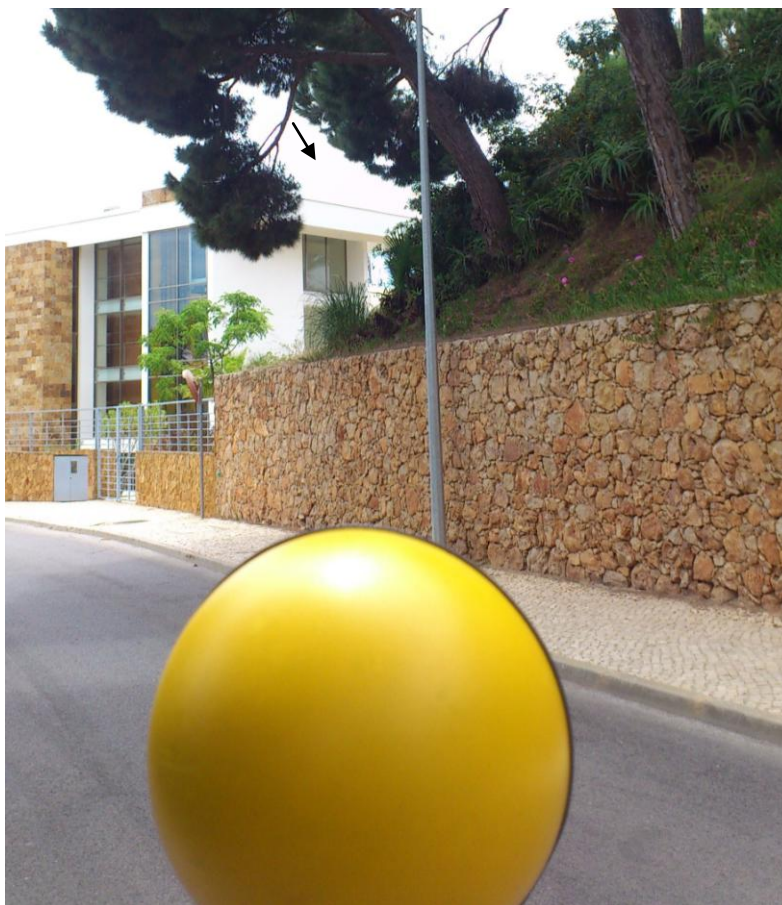
Fig. 5 – Ponto 3