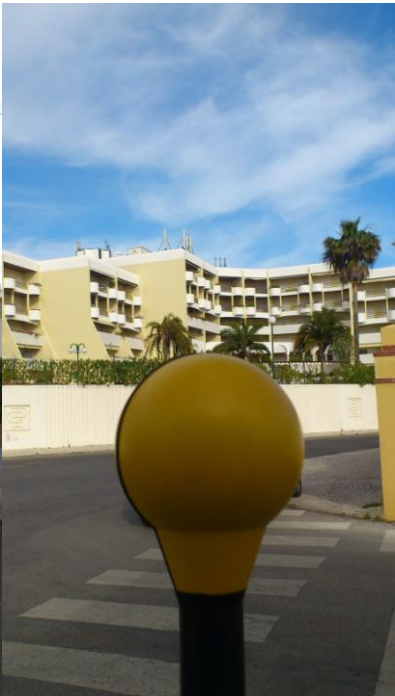
Fig. 8 – Ponto 6