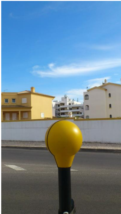
Fig. 6 – Ponto 4