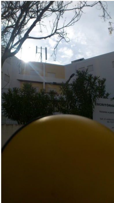
Fig. 3 – Ponto 1