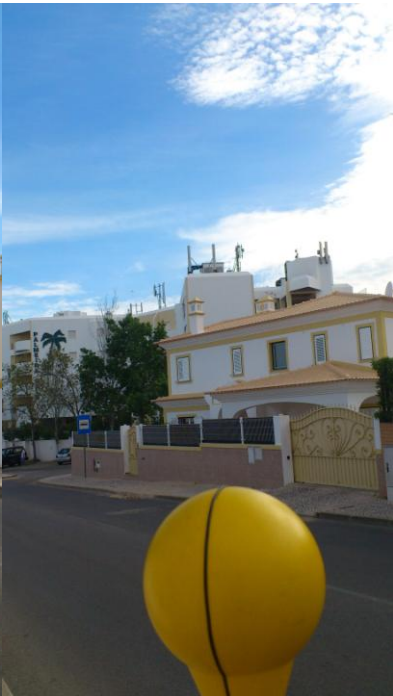
Fig. 7 – Ponto 5