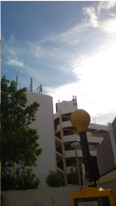
Fig. 5 – Ponto 3