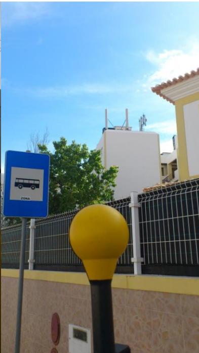
Fig. 4 – Ponto 2