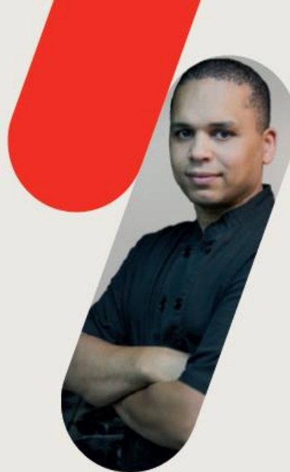
João de Brito Gomes Cozinha de Bairro facebook.com/cozinha-de-bairro